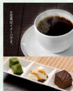
【三種のデザートの内容は併席にお尋ねください。】