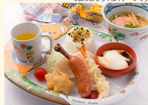
小盛・卵・乳・エビ

※当店では、国内産のお米を使用しております。 ※季節により食材又は盛り付け、器等が変更場合がございます。